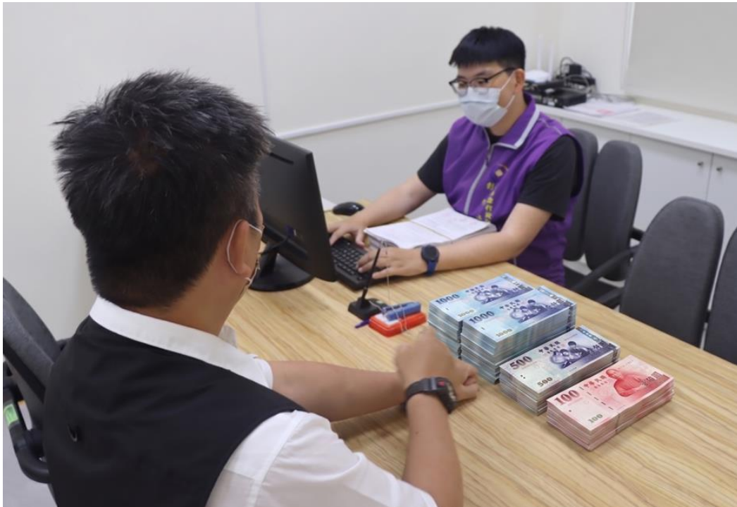
義務人到場繳款(AI 修正示意照片)