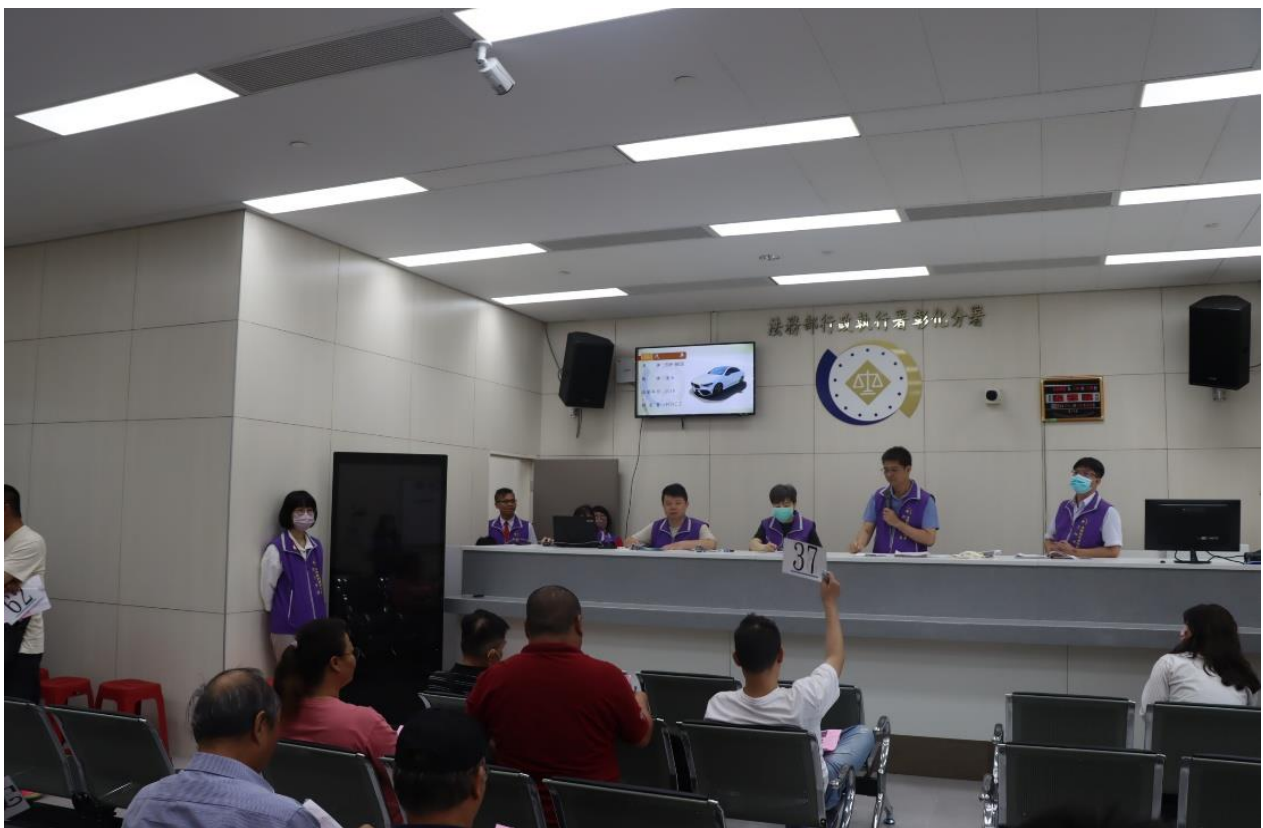
賓士豪華房車 69 次喊價競標