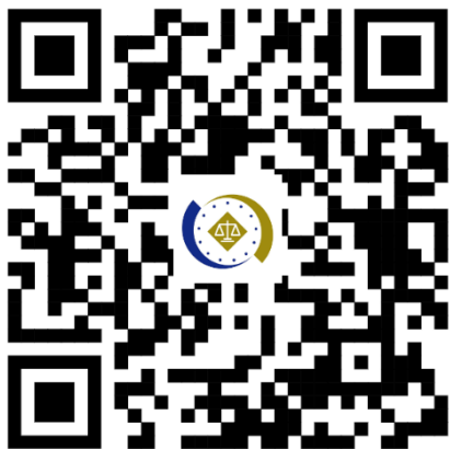
法務部行政執行署拍賣公告查詢系統

想掌握第一手法拍資訊嗎？彰化分署呼籲有興趣的民眾，請密切關注官方網站或追蹤臉書、IG（帳號：chymoj168），一起搶好康、學防詐，好禮拿不完！