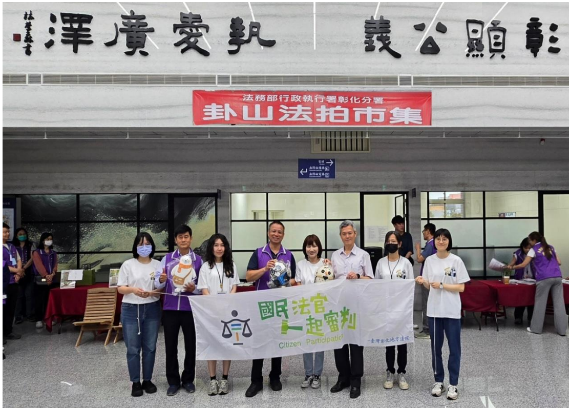
彰化地院蔡科長（右4）率領同仁設攤進行國民法官宣導，與彰化分署郭分署長（右3）合影