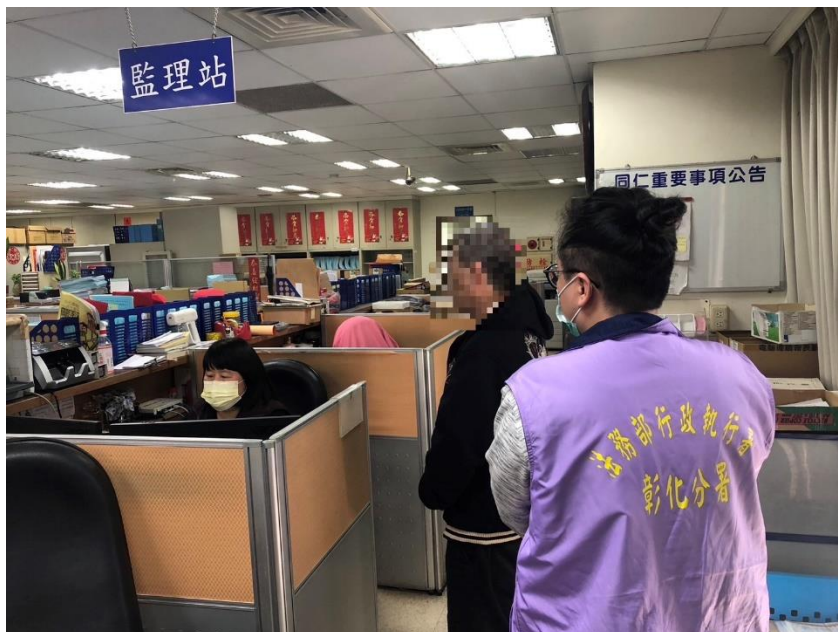
▲林姓義務人到場繳納