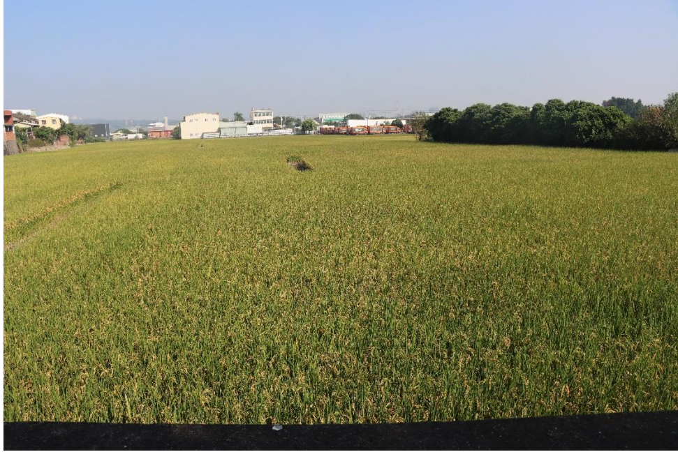
▲香山段 874 地號現況