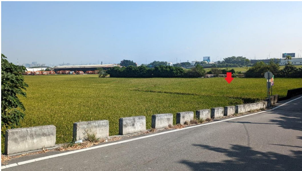
▲香山段 874 地號現況