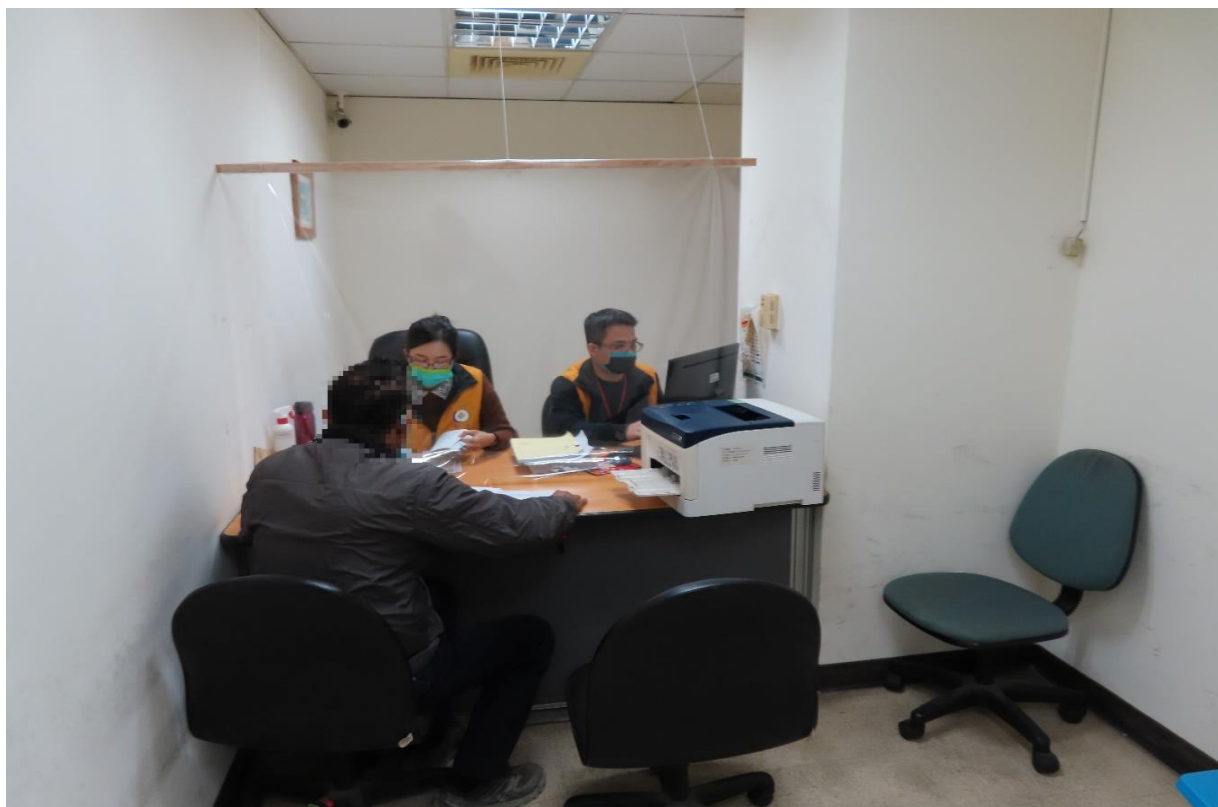
彰化分署行政執行官(右二)詢問陳男