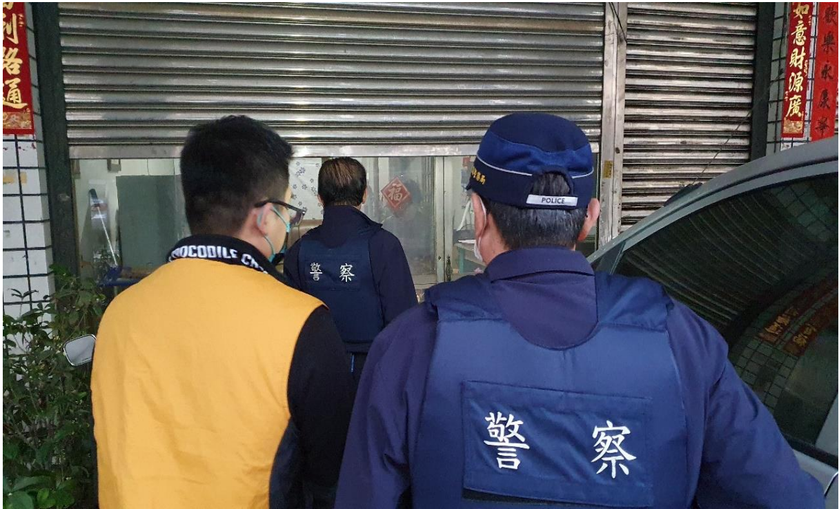
彰化分署執行人員(左一)偕同轄區警員前往陳男住家拘提